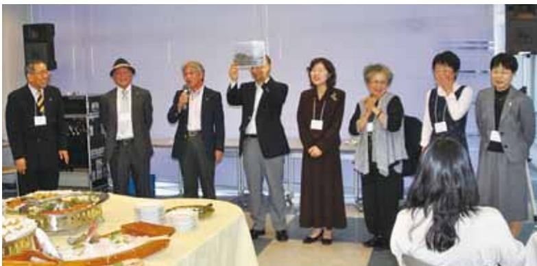
(引き続き、次のページに部会報告の補足があります)

又、DBCを結んでいる東京山手クラブが同じく来年9月に60周年を迎えられる事がわかりました。このことも覚えておきたいと思えます。(橋崎)