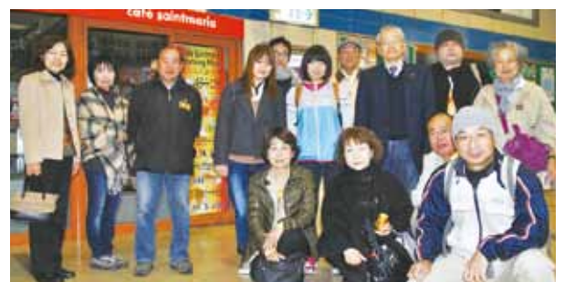
ツアー出発日のお見送り